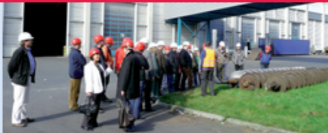
Bei Betriebsbesichtigungen und Workshops findet ein intensiver Austausch statt und werden umweltbezogene Themen erarbeitet.

Durch eine umfassende Bestandsaufnahme und Analyse aller Betriebsbereiche wird herausgefiltert, wo Einsparungen möglich sind. Ziel ist es, die Umwelt zu entlasten und gleichzeitig Betriebskosten auf Dauer zu senken. Die angestoßenen Investitionen amortisieren sich meist in kurzer Zeit.