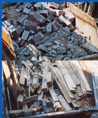
Abfall-/Wertstofftrennung im Baubetrieb