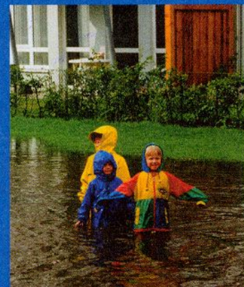
Regenwasser-Versickerung, hier mit „Zwischennutzung“