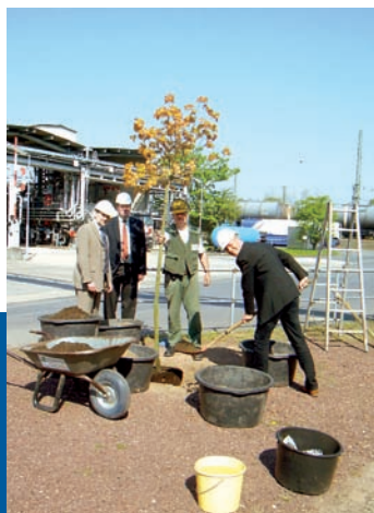
Baumpflanzaktion mit dem Bundestagsabgeordneten Dr. Matthias Miersch