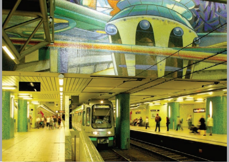
Stadtbahn Station Kröpcke – zentraler Umsteigepunkt für 140.000 Fahrgäste täglich